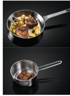
Präzise Kontrolle durch TouchControl